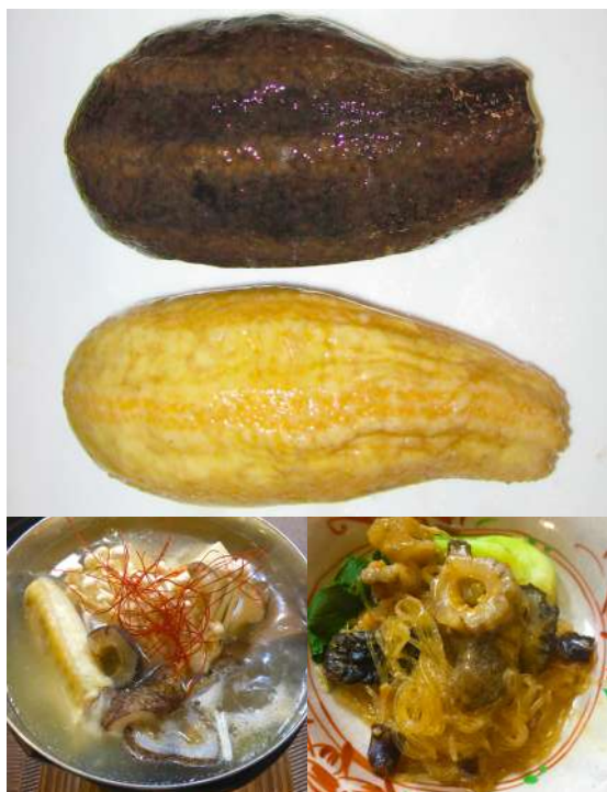
とても美味しいキンコ料理